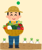
あんぜん あんしん のうちくさんぶつ つく ①安全・安心な農畜産物を作る