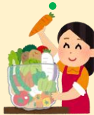
こくさん しょうざい か ②国産の食材を買う