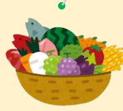
しょうひしゃ とど ③消費者のところに届ける