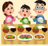
しょうひしゃ と く A 消費者の取り組み

こくしょうこくさん すす と く 国消国産を進めるために、どのような取り組みがあるでしょうか？ せん むす 線で結びましょう。